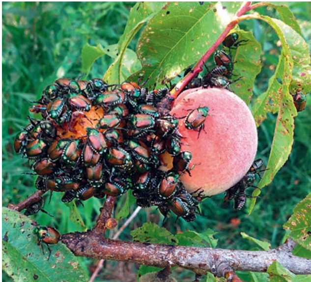
Japankäfer fressen unter anderem Blätter und Früchte von Ahornbäumen und Ulmen, aber auch von Obstbäumen wie Pfirsich und Kirschen.