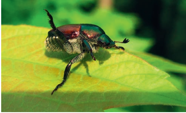
Wird der Japankäfer gestört, so spreizt er zwei Beine vom Körper.